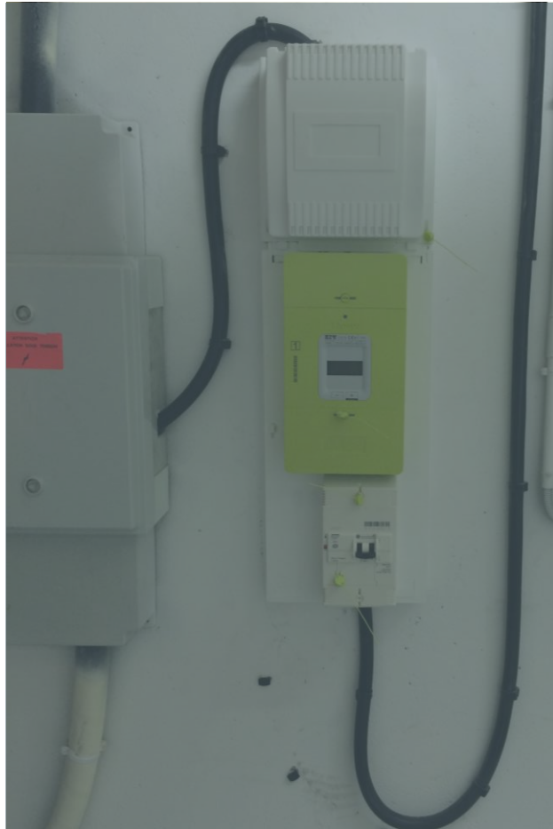
NOUVEAU COMPTEUR RELIÉ AU PIED DE LA COLONNE ENEDIS