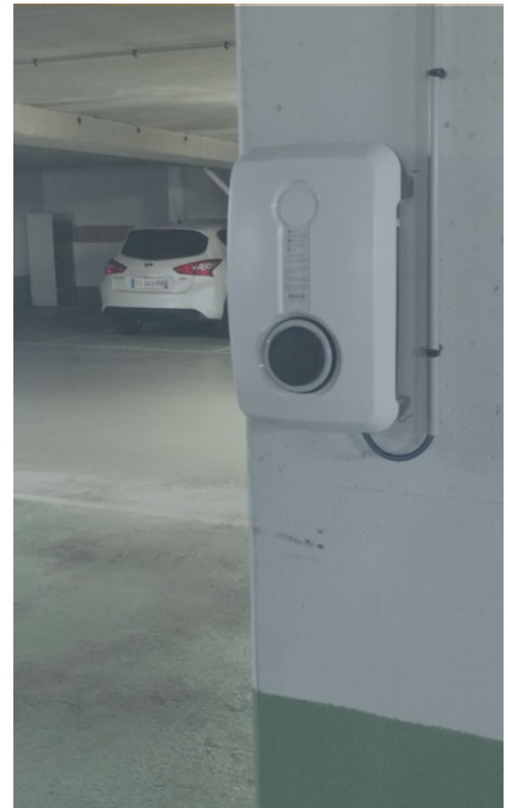
LES BORNES DE RECHARGE INDIVIDUELLES INSTALLÉES AU FIL DES DEMANDES